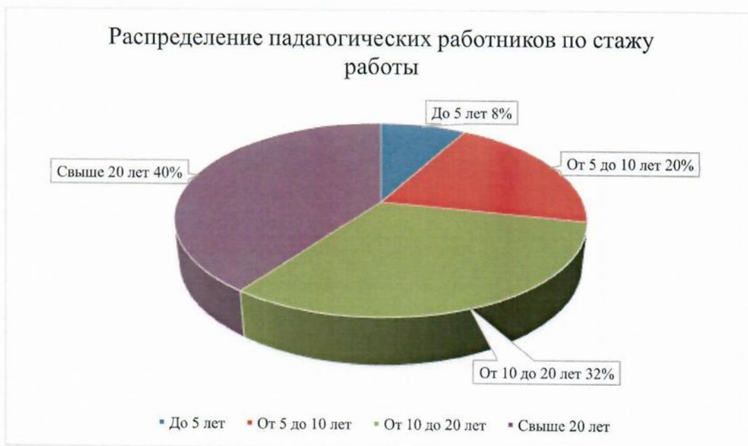
Диаграмма с характеристиками кадрового состава педагогов МБДОУ № 8 г.Тосно «Сказка»

переподготовку по дошкольному воспитанию, 1 педагог проходит обучение в ВУЗе по педагогической специальности.